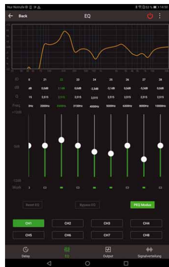
Die App bietet nahezu volle Funktionalität, hier bei Equalizern und Frequenzgangdarstellung