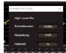
Das automatische Überblenden bei Fahrzeugtönen lässt sich in Empfindlichkeit, Dämpfungsmaß und Haltezeit einstellen

Beim DSP wird nicht gegeizt, das wird nach dem Aufschrauben der M6 sofort klar. Ein vergleichsweise riesiger DSP-Chip fällt sofort ins Auge und entpuppt sich als C6720 von Texas Instruments, ein 32-Bit-Fließkommachip mit schnellen 350 MHz Taktfrequenz. Ihm zur Seite steht der vielfach bewährte PCM3168A (ebenfalls TI), der sowohl die AD- als auch die DA-Wandlung übernimmt. Damit ist die M6