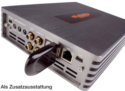
Als Zusatzausstattung gibt es Bluetooth-Dongles für Audiostreaming und App-Steuerung

zutritt. Die vier vorhandenen Cinchbuchsen verteilen sich auf zwei prozessierte Ausgänge und den analogen Aux-in, weiterhin gibt es einen optischen Digitaleingang und eine USB-Schnittstelle für einen Bluetooth-Dongle, der jedoch nicht zum Lieferumfang gehört. Die Haupteingänge sind wie die Lautsprecherausgänge als Molex-Stecker ausgeführt, eine Praxis, die Platz spart und sich immer mehr durchsetzt. Ganze 6 High-Level-Kanäle kann die M6 aufnehmen, so dass auch bei komplizierteren Werksanlagen kein Signal verlorenght. Alle Eingänge können auf alle Ausgänge geroutet werden, wobei sich sogar die Pegel von 0 – 100 einstellen lassen, so dass beliebig summiert werden kann. Zum Umgehen von Diagnosefunktionen des Werksystems sind die Eingänge so niederohmig ausgelegt, dass zumindest bei einer ganzen