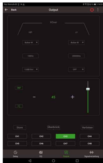
Die Frequenzweichen können auch mit der App eingestellt werden, genau wie Laufzeit, Pegel etc.