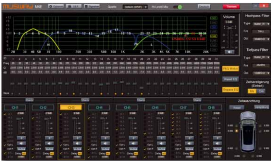
Das Hauptfenster bietet alles auf einen Blick. Die Bedienung ist kein Problem auf dem PC

zutritt. Die vier vorhandenen Cinchbuchsen verteilen sich auf zwei prozessierte Ausgänge und den analogen Aux-in, weiterhin gibt es einen optischen Digitaleingang und eine USB-Schnittstelle für einen Bluetooth-Dongle, der jedoch nicht zum Lieferumfang gehört. Die Haupteingänge sind wie die Lautsprecherausgänge als Molex-Stecker ausgeführt, eine Praxis, die Platz spart und sich immer mehr durchsetzt. Ganze 6 High-Level-Kanäle kann die M6 aufnehmen, so dass auch bei komplizierteren Werksanlagen kein Signal verlorenght. Alle Eingänge können auf alle Ausgänge geroutet werden, wobei sich sogar die Pegel von 0 – 100 einstellen lassen, so dass beliebig summiert werden kann. Zum Umgehen von Diagnosefunktionen des Werksystems sind die Eingänge so niederohmig ausgelegt, dass zumindest bei einer ganzen