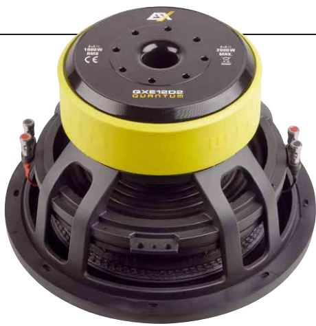
Beide QXE-Subs teilen sich denselben Antrieb mit zwei schweren Ferritringen und Dreizollspule

Waage, wofür die jeweils zwei fetten Ferritringe mit 25 Millimeter Stärke mitverantwortlich sind. Auch die Hardware in Form der sauber gedrehten Polplatten fällt natürlich äußerst massiv aus. In der unteren Polplatte sind neben der obligatorischen Polkernbohrung auch kranzförmig angeordnete Lüftungslöcher für den Raum unter der Schwingspule vorhanden, sodass auch der letzte Hohlraum der Woofer vorbildlich belüftet ist. Bei den Membranen gibt es keine Experimente, hier kommen dicke Papiermembranen zum Einsatz, die von hochprofiligen Schaumsicken geführt werden, wie es im modernen Subwooferbau üblich ist.