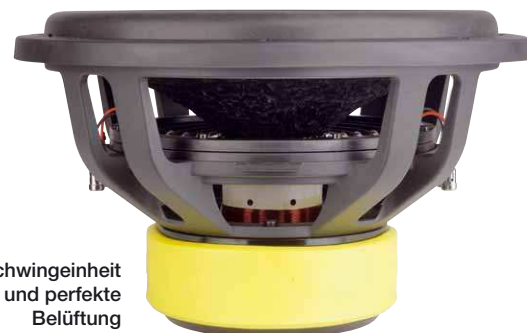
Der neue Gusskorb bietet der Schwingereinheit großzügige Bewegungsfreiheit und perfekte Belüftung

Millimeter mechanischen Hub, in jede Richtung natürlich. Der lineare elektrische Hub beträgt beeindruckende 22 Millimeter, womit die QXEs zu den extrem langhubigen Woffern gehören. Beide bringen etliche Kilos auf die