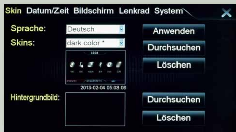
Eigene Hintergrundbilder können geladen werden