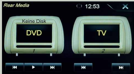
Eigenes Programmangebot für die Passagiere